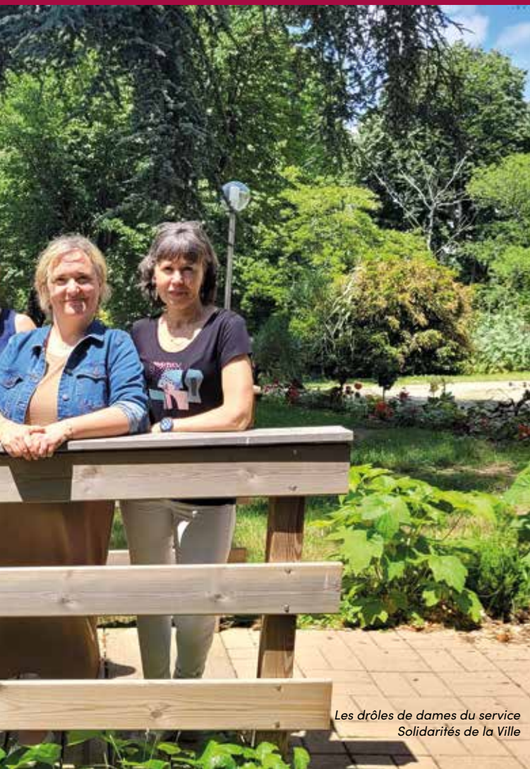
Les drôles de dames du service Solidarités de la Ville